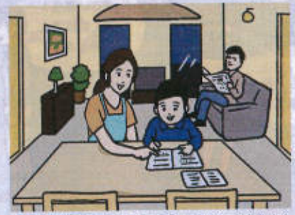
LDを子どものスペースとして活用すれば、家族4人もOK。田んらの時間も多くなりそう

「2LDKは居室が2つあるので、共働き夫婦なら寝室と身支度する衣装部屋に分けて使っても、子ども1人なら、個室を与えるのも容易です」。心配なのは子どもが2人になったときだが、「子どもは自分のスペースがあるだけで安心します。6～7畳の空間を家具など仕切ってきょうだいで使ったり、LDに勉強コーナーをつくり、部屋は寝るだけとしてもいいですよ」