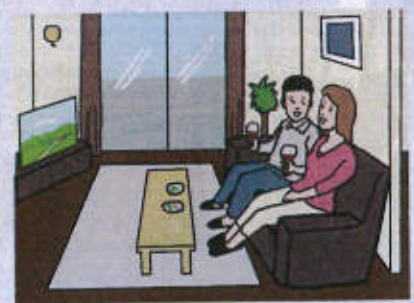
LDの広さもしっかり確保されているから、「週末は家でゆっくりしたい」という共働き世帯にピッタリだ

2LDKの場合、50㎡～60㎡半ばが中心。広さで比べれば、3LDKよりは狭くなる。「ただし、LDの広さは3LDKとほぼ変わらないか、時にはより広く設計されることも。家具が置きにくいということは、まずないでしょう」(古屋さん、以下同じ)。水まわりのスペースも、3LDKと変わらないプランがほとんどか。夫婦2人なら2LDKで十分というわけだ。